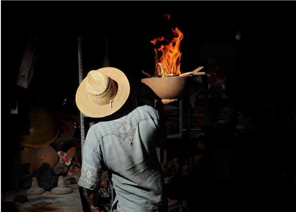
De la serie: La memoria del barro. Año: 2017. Metepec, Estado de México, México.