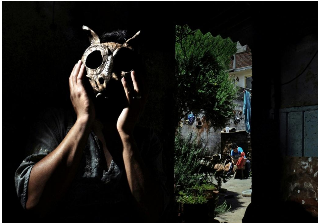
De la serie: La memoria del barro. Año: 2017. Metepec, Estado de México, México.