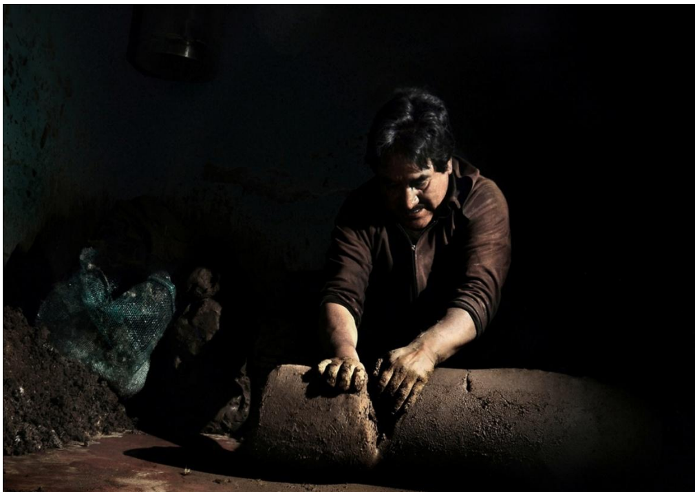
De la serie: La memoria del barro. Año: 2017. Metepec, Estado de México, México.