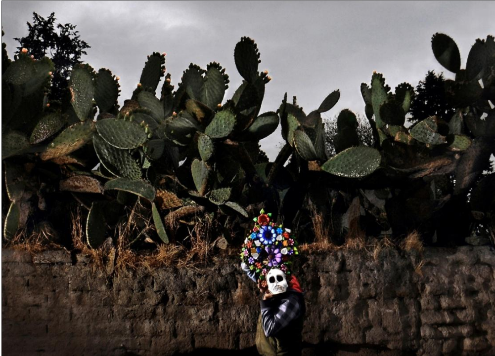
De la serie: La memoria del barro. Año: 2017. Metepec, Estado de México, México.