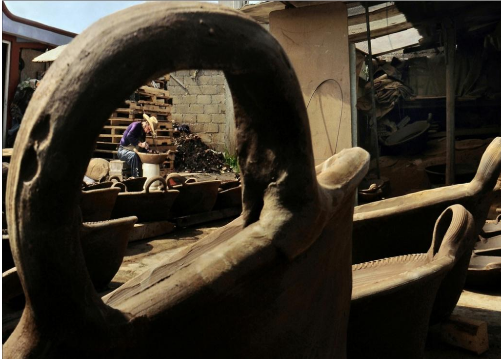
De la serie: La memoria del barro. Año: 2017. Metepec, Estado de México, México.