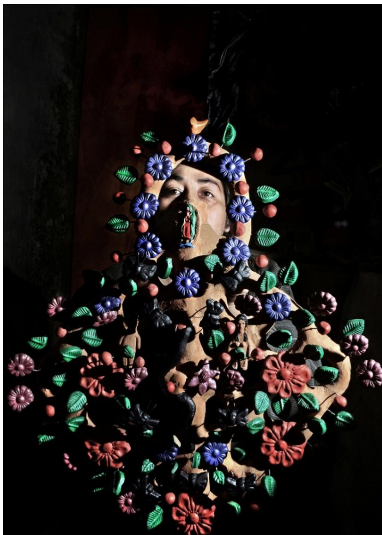
De la serie: La memoria del barro. Año: 2017. Metepec, Estado de México, México.