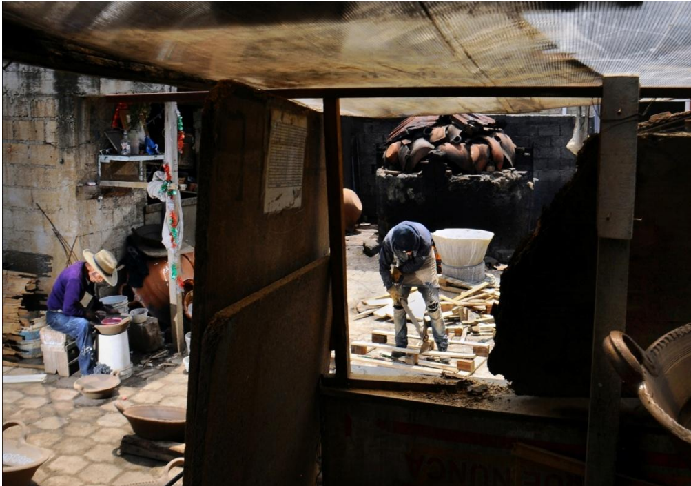
De la serie: La memoria del barro. Año: 2017. Metepec, Estado de México, México.