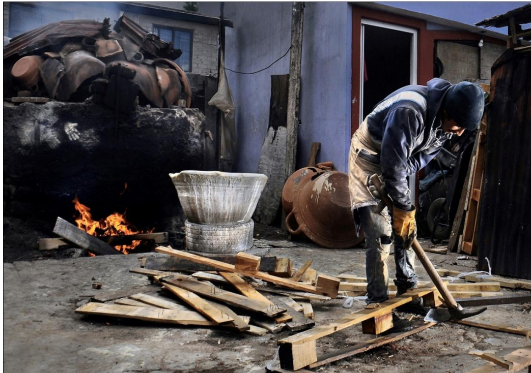
De la serie: La memoria del barro. Año: 2017. Metepec, Estado de México, México.