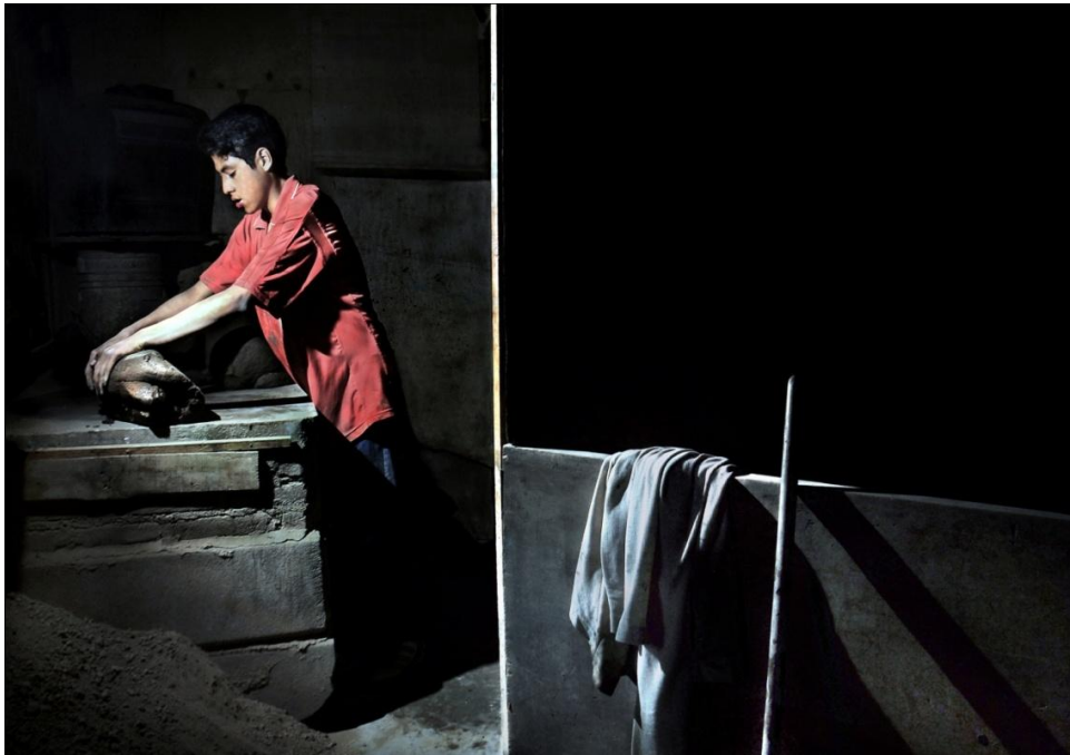
De la serie: La memoria del barro. Año: 2017. Metepec, Estado de México, México.