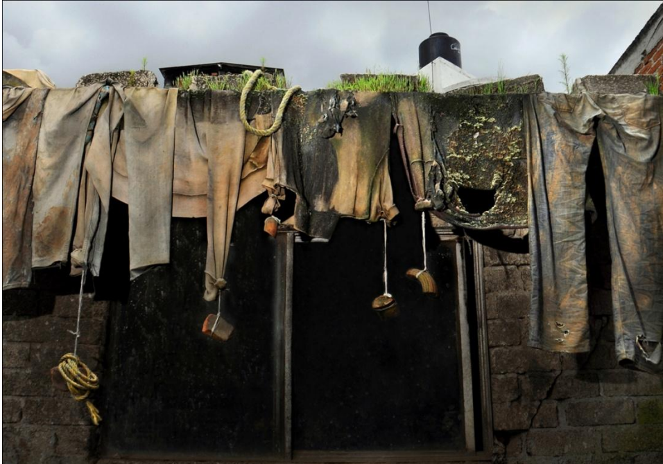
De la serie: La memoria del barro. Año: 2017. Metepec, Estado de México, México.