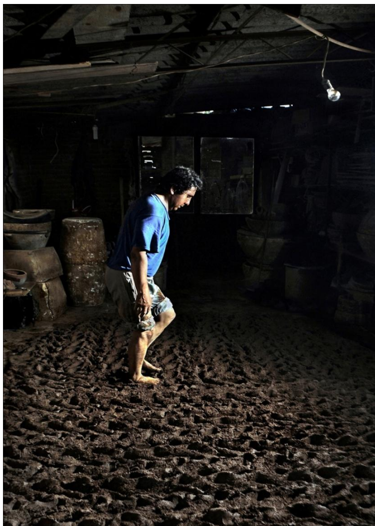
De la serie: La memoria del barro. Año: 2017. Metepec, Estado de México, México.