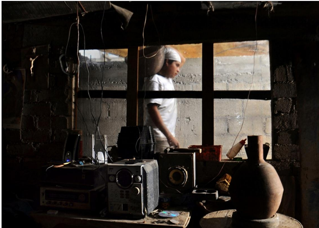
De la serie: La memoria del barro. Año: 2017. Metepec, Estado de México, México.