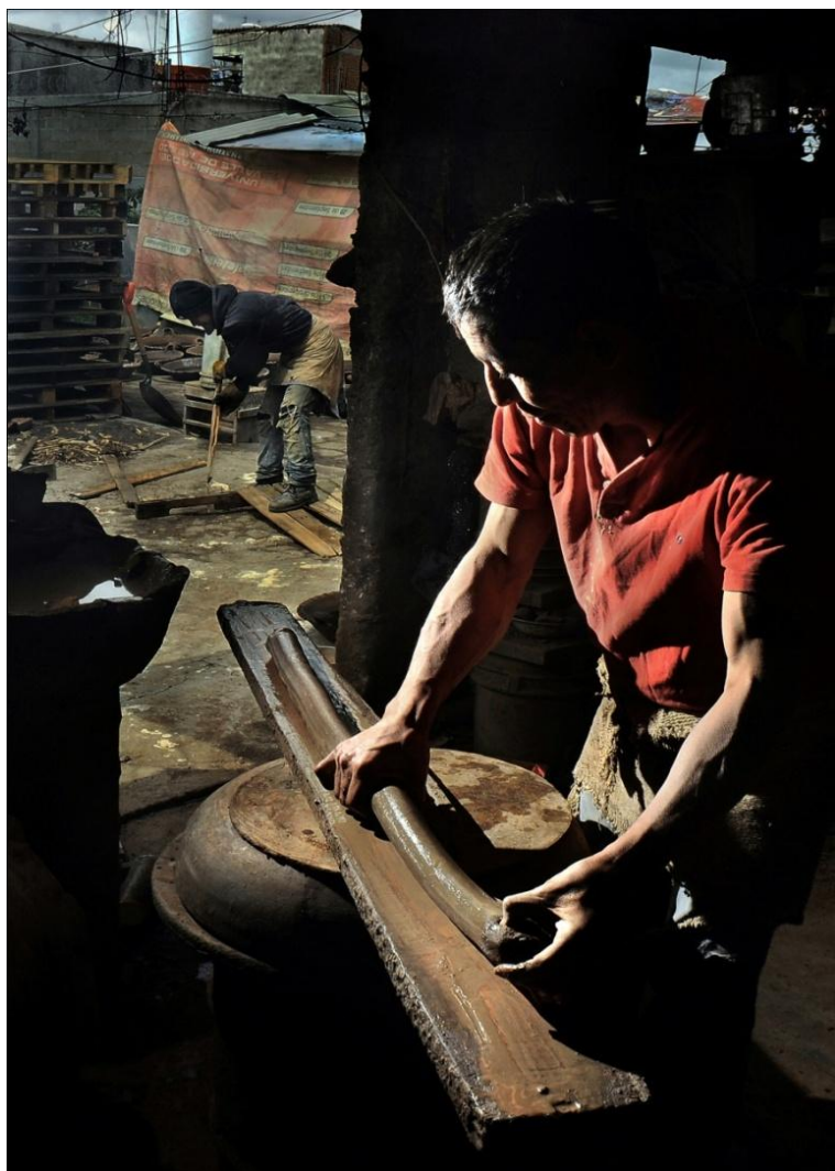
De la serie: La memoria del barro. Año: 2017. Metepec, Estado de México, México. Fotografía: Fernando Oscar Martín