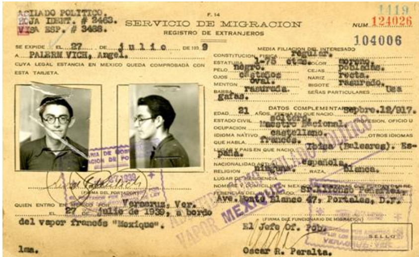
Imagen 1. Documento de migración de Ángel a su entrada a México