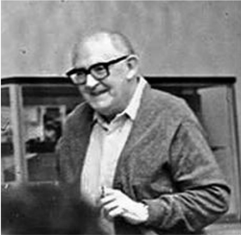
Imagen 9. Ángel Palerm en la Casa Chata, 1973. Cátedra Ángel Palerm, sección Galería 1.