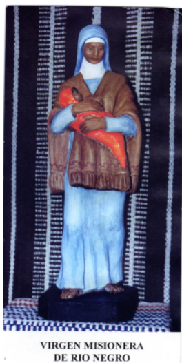
Figura 4. Virgen Misionera de Río Negro