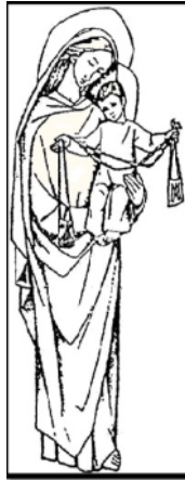
Figura 7. Imagen de la Virgen del Carmen