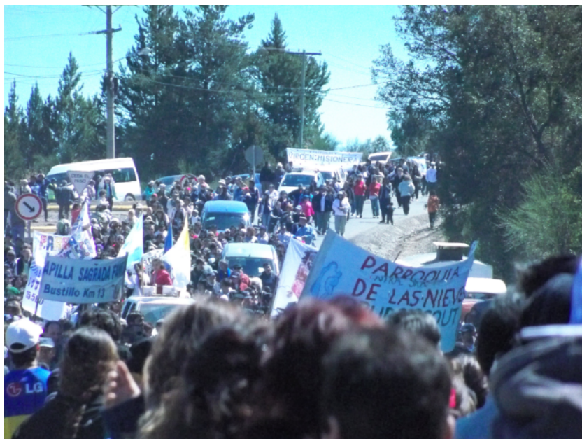
Foto 6. Peregrinación diocesana 2016.