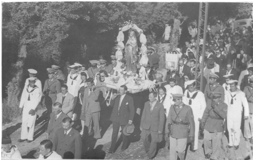
Figura 1. Peregrinación de la Inmaculada 8/12/1945.