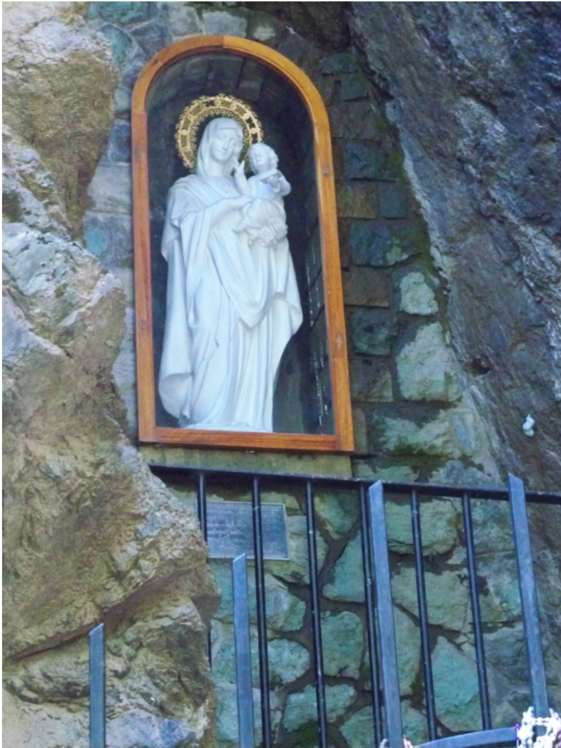
Figura 5. Imagen de la Virgen de las Nieves en su gruta.