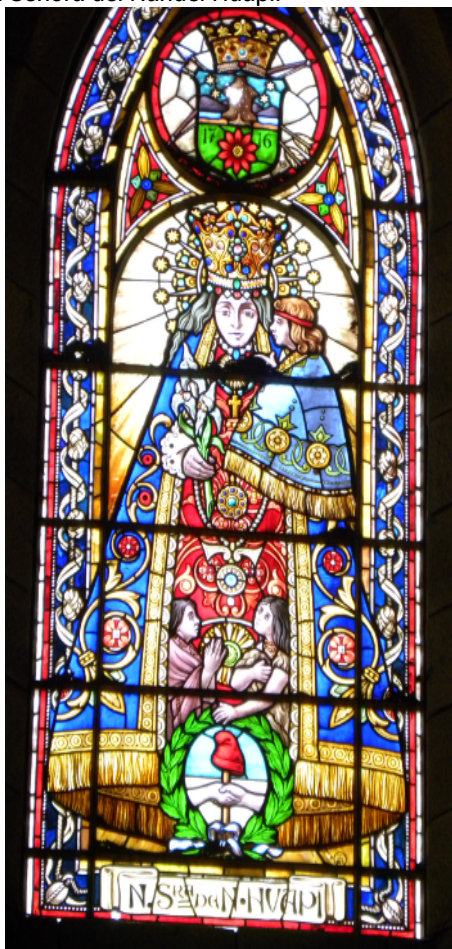
Figura 2. Nuestra Señora del Nahuel Huapi.

man "las peregrinaciones de distintos sectores sociales [...] hacen de ese camino y de ese espacio sacralizado en los santuarios a los que arriban su propio escenario religioso" (2013: 12).